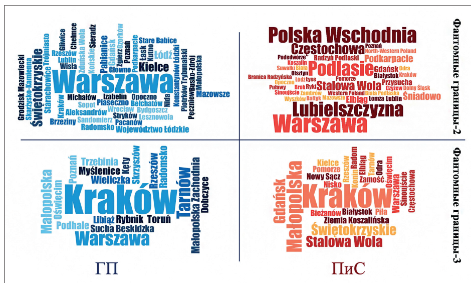
Рис. 2. Облако кодов категории «география»

Как и в предыдущем случае столица воеводства — Краков — упоминается чаще всего (фантомные границы-3). На втором и третьем местах у политиков ГП, соответственно, Варшава (Мазовецкое воеводство) и Тарнув (Малопольское воеводство). Частое упоминание Варшавы в фантомном пространстве-3 объясняется тем, что вице-председатель ГП и мэр Варшавы Рафал Тшасковский активно ездил по регионам, оказывая поддержку кандидатам в мэры Кракова и Тарнува, параллельно ведя собственную кампанию по переизбранию в столице. В каждом своем выступлении он не только подчеркивал достоинства поддерживаемых кандидатов, но и представлял элементы собственной избирательной программы в Варшаве.