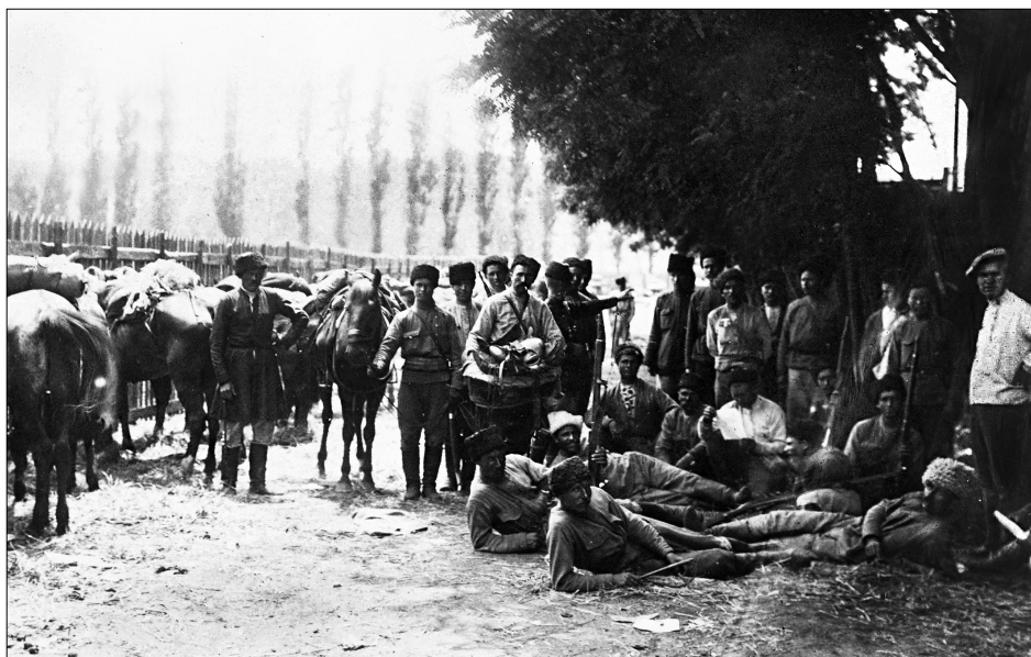
1-я Кавказская конная дивизия белых в Екатеринославе. 1919 г. The 1st Caucasian Cavalry Division of the Whites in Yekaterinoslav. 1919.