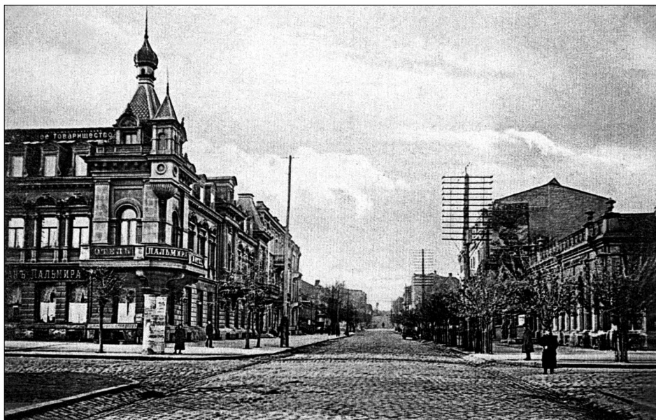
Екатеринослав (дореволюционная открытка) Yekaterinoslav (pre-revolutionary postcard)