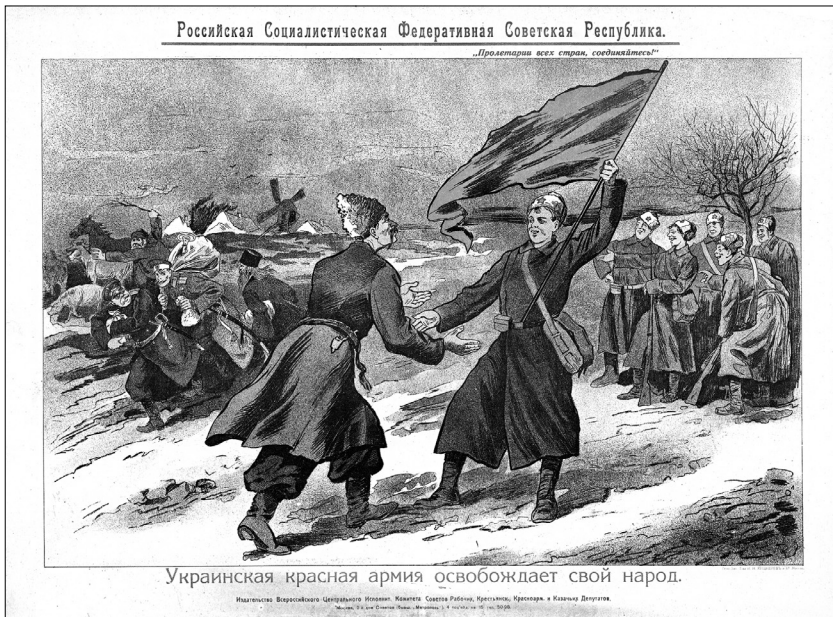
Украинская Красная армия освобождает свой народ (Советский плакат. 1919 г.) The Ukrainian Red Army liberates its people (Soviet poster. 1919)

Что пришлось пережить, трудно описать, так как, во-первых, я жил в буржуазной реквизированной квартире, а, во-вторых, кругом жили семьи, отцы которых ушли с белыми. Спрятаться где-либо в другом месте не пред-