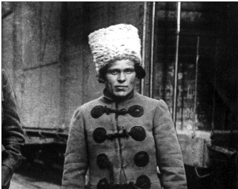
Н.И. Махно Nestor I. Makhno

почти все полевые части передали в ведение штаба обороны. Штаб армии ушел из Екатеринослава, командарм где-то обретался в передовой линии. Донесения, по-видимому, или сосредотачивались в штабе обороны или же посылались с места непосредственно в высшие инстанции. По крайней мере, в полевом штабе их не было, а если и были, то весьма старые.