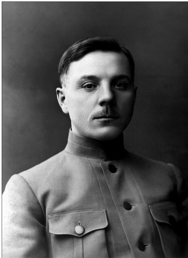
К.Е. Ворошилов. 1918 г. Kliment E. Voroshilov

говского-Сокола 8 . Последний в публикуемом документе утверждал, что на самом деле попал в плен 9 , однако на территории белых в Ейске находилась семья военспеца, позднее вместе с ним оказавшаяся у красных. Следовательно, военспец вполне мог стремиться к родным. Также в Екатеринославе остались состоявший для поручений при начальнике штаба, начальник административного отдела, начальники организационного и оперативного отделений, помощник начальника разведывательного отделения, переводчики, лица, состоявшие в резерве комсостава, делопроизводители и даже уборщики. Перебежчиков исключили из списков и объявили вне закона.