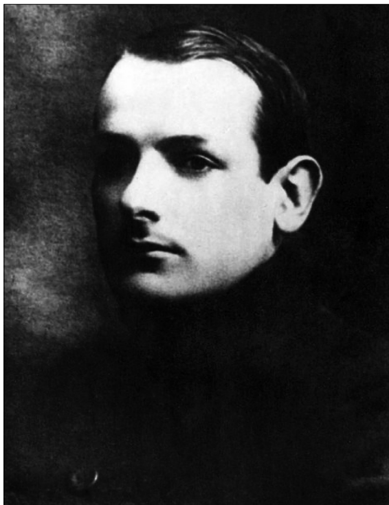
В.И. Межлаук Valery I. Mezhlauk

Показательно, что заменивший Шкляр-Олексюка бывший штабс-капитан К.Ф. Монигетти также вскоре перешел к белым 10 . Черета неудач отразилась на карьере Ворошилова, которого сняли с поста командующего и предали суду. Впрочем, никакого наказания не последовало.